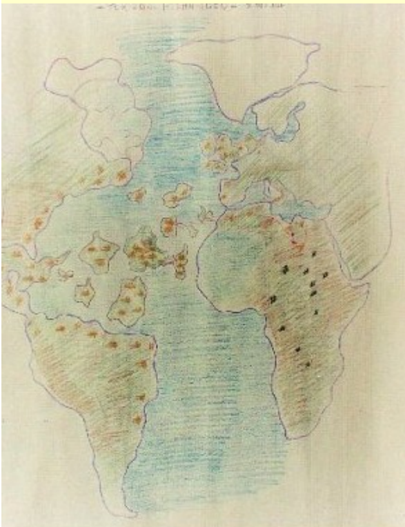
Ultimo periodo Atlantideo

Iniziano gli incroci. Per prima la razza Bronzea con la Rossa (Nera più Lemure) dando la razza color Rame, iniziatrice delle popolazioni pre Atlantidee. Poi l'incrocio della razza Rame con la Bianca dando la più potente generazione umana: l'Atlantidea. Questo assestamento sia geologico che umano si protrae fino a 175.000 anni fa, momento particolare in cui la volontà dei Creatori dell'Uomo decide di seguirlo da vicino, essendo arrivata la adatta maturazione animico-spirituale, capace di concepire lo sviluppo della coscienza superiore.