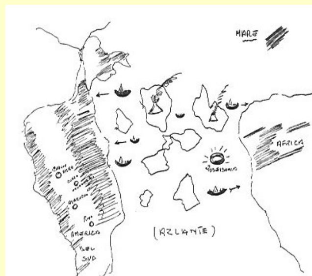
Ultimo periodo Atlantideo